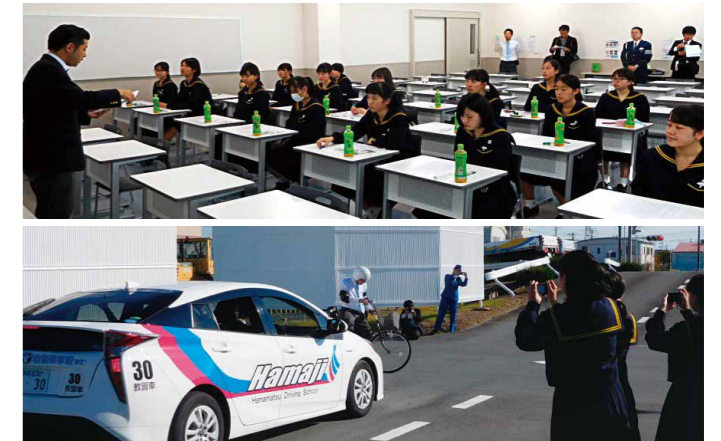
▲西遠女子学園生徒のみなさん(浜松自動車学校にて)

自動車から見た自転車、自転車から見た自動車の危険性を理解してもらい、防衛運転を意識していただきました。