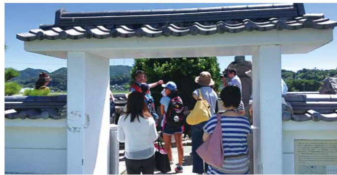
▲井伊直虎ゆかりの地めぐり