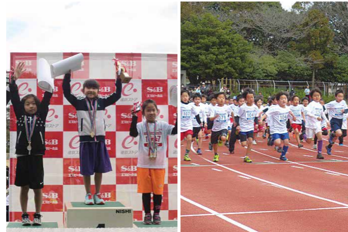
▲浜松市四ツ池公園陸上競技場

当日は、県西部のみならず、豊川市、豊橋市の小学生854名が参加し、学年別に1.5キロ、2キロ、3キロのコースを元気いっぱい駆け抜けました。