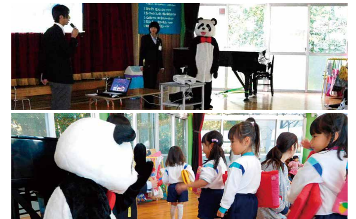
▲わかさ幼稚園にて

当日は、162名の園児に向け、パトカーや消防車などのクイズや交通事故に関する動画を視聴し、交通ルールの大切さを学んでいただきました。