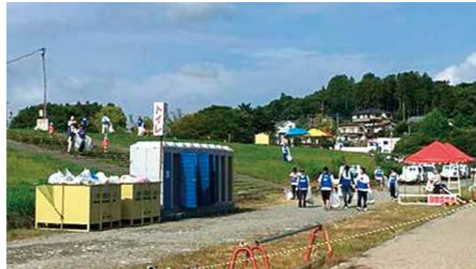
▲ボランティア参加者

当日は早朝にもかかわらず猛暑の中、グループ各社から64名の皆様に参加いただき、たくさんの汗をかきながら会場のごみ拾いを行いました。