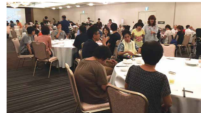
▲ホテルコンコルド浜松

当日は、施設利用者の方にも食べやすいサイズで料理を提供するなど工夫をいたしました。