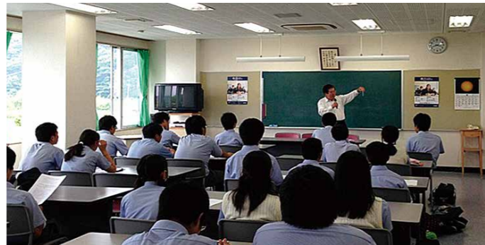
▲高校生向け食中毒予防衛生講習会