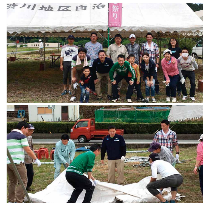
▲一社一村つつじまつり

遠鉄トラベルは一社一村しずおか運動に参加しており、北区引佐町の渋川地区と協働活動を行っております。14名の社員が渋川地区の方たちと共に、渋川つつじ祭りの会場舞台や、テント設営を行いました。今後も、様々な活動を通じて、渋川地域に貢献してまいります。