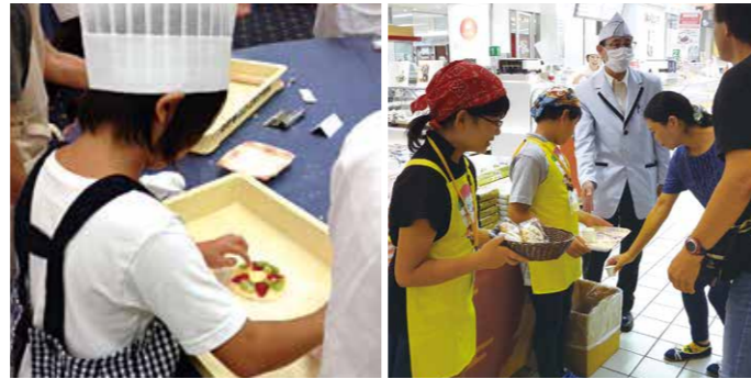
▲遠鉄百貨店でのケーキづくりのお仕事体験 ▲直虎お土産ショップ販売体験

今回は特別に直虎お土産ショップにて販売のお仕事体験や、直虎ゆかりの地めぐりを行い、たくさんのお子様にご参加いただきました。