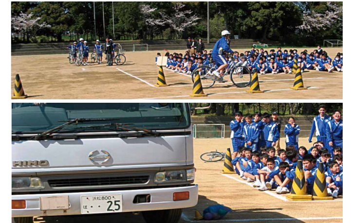
▲磐田市立神明中学校にて

当日は学生の皆さんに自転車事故を模擬体験していただき、交通安全への意識をより高めていただくとともに、マナー向上、危険予測・回避等の「実践力」を養うことの大切さをお伝えしました。