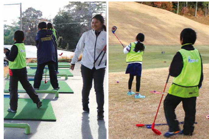
▲浜松カントリークラブにて

えんてつグループでは、えんてつカードキッズクラブ会員様を対象に、12月に浜松カントリークラブにて「はじめてのゴルフ教室」を開催しました。当日は「スナッグゴルフ」というお子様でも簡単に挑戦することができるゴルフ入門スポーツを体験してもらい、子供たちには思いっきり体を動かす楽しさを感じてもらうとともに、新しいことに興味をもつ大切さを学んでいただきました。