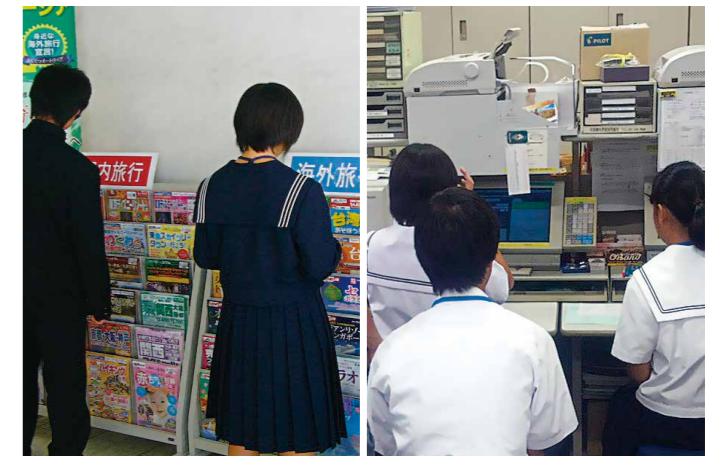
▲中学生の職場体験学習

遠鉄トラベルでは2017年9～11月に中学校7校の職場体験業務の受け入れを実施いたしました。学生には観光プラザのパンフレット整理や事務作業の補助、おすすめ旅行プランのPOP作成に取り組んでいただき、将来について考える良いきっかけづくりをしていただきました。