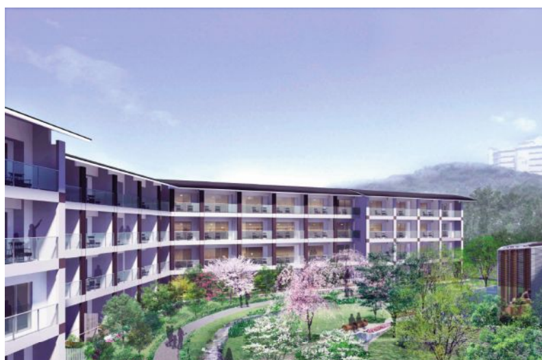
新ホテル「HOTEL WELLSEASON 浜名湖」の外観予想図