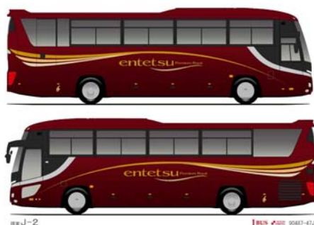
ワインレッドタイプ