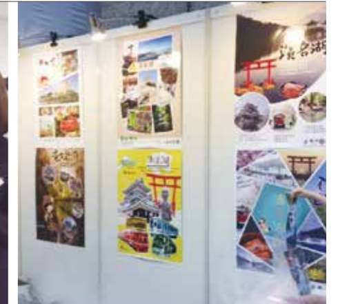
▲作成したポスター