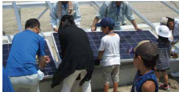
▲遠鉄建設での太陽光パネル設置体験