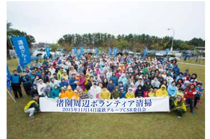
▲ボランティア参加者

遠鉄グループでは、CSR委員会主催で、毎年11月に、市内の観光名所等の清掃活動を実施しています。平成27年度は、「ゆるキャラGP」会場となる「渚園」でグループ合同清掃ボランティアを行いました。当日は雨の中グループ従業員とその家族約600名が参加し、汗を流しました。翌週「ゆるキャラGP」が開催され、きれいになった会場で全国からゲストを迎えるお手伝いすることができました。