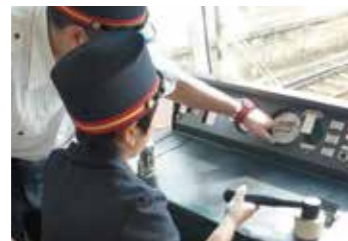
▲トレインフェスタの運転手体験

地域の子供たちに、様々な乗り物に触れ、体験していただくことで将来の職業選択の一助としていただくことを目的に、「のりものフェスタ」「トレインフェスタ」を開催しました。新浜松駅前のソラモでは、警察車両やバスなどの展示乗車体験を、西鹿島駅では赤電の車両工場の見学会を行い、多くの子供たちに楽しんでいただきました。