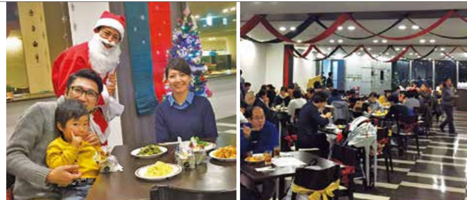
▲スカイテラスのクリスマスディナー

遠鉄グループでは、従業員とその家族にメールアドレスを登録いただき、タイムリーに福利厚生情報を届ける体制を整えています。平成27年度では、スポーツやコンサートのチケット、グループ施設の無料体験等、約60種類の福利厚生プランを配信し、3千名を超える従業員とその家族にご利用いただきました。