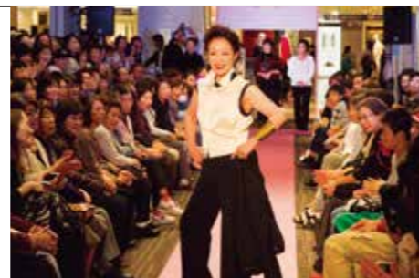
▲ファッションショー

遠鉄百貨店では、イ・コイ・スクエア3階にて「えんてつコレクション2015～輝くミセスのためのファッションショー～」を開催しました。60歳以上のモデルを募集し、抽選で当選された60名が、プロによるウォーキング指導やヘアメイク後、華やかに変身されて憧れのランウェイを歩きました。