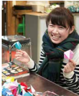
▲ひな祭りの飾りづくり

遠鉄トラベルでは静岡県主催の一社一村運動に参加しています。平成27年度は北区渋川にて活動をいたしました。ひな祭りの飾りつけや援農ボランティアなどの活動を通じて、少子高齢化が進む農村地域の活性化や自然環境の保全に寄与しています。