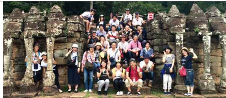
▲カンボジア研修団

グループ従業員を対象に「カンボジア」「ベトナム」「台湾」の3班に分かれてASEAN研修を実施いたしました。日系企業の先進事例と進出先の経済活動等を視察しました。「カンボジア」研修においては、県西部の大学生6名を招待しております。