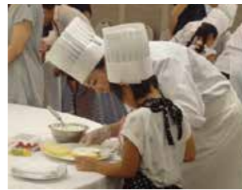
▲ホテルコンコルド浜松での料理体験

えんてつカードキッズクラブ会員様を対象に、遠鉄グループ各社での「お仕事体験」や「自然体験」計26タイトルのイベントを開催いたしました。ホテルコンコルド浜松での「パティシエとケーキ作り体験」や遠鉄百貨店での「試食販売体験」「案内所お仕事体験」など、多数のお子様にご職業体験をしていただきました。