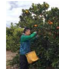
▲みかんの収穫作業

みかん農家の中には、後継者不足等の影響により、人手が必要な収穫シーズンに、満足に作業ができない所が多くあります。三ヶ日町において、みかんの収穫の援農ボランティアにグループ従業員が参加いたしました。