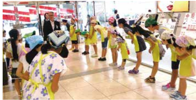
▲遠鉄百貨店での出迎え体験