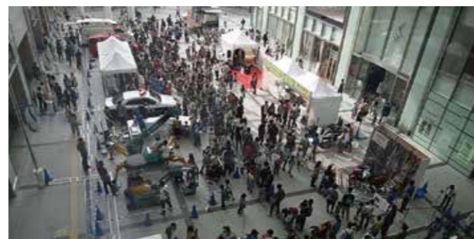
▲のりものフェスタ