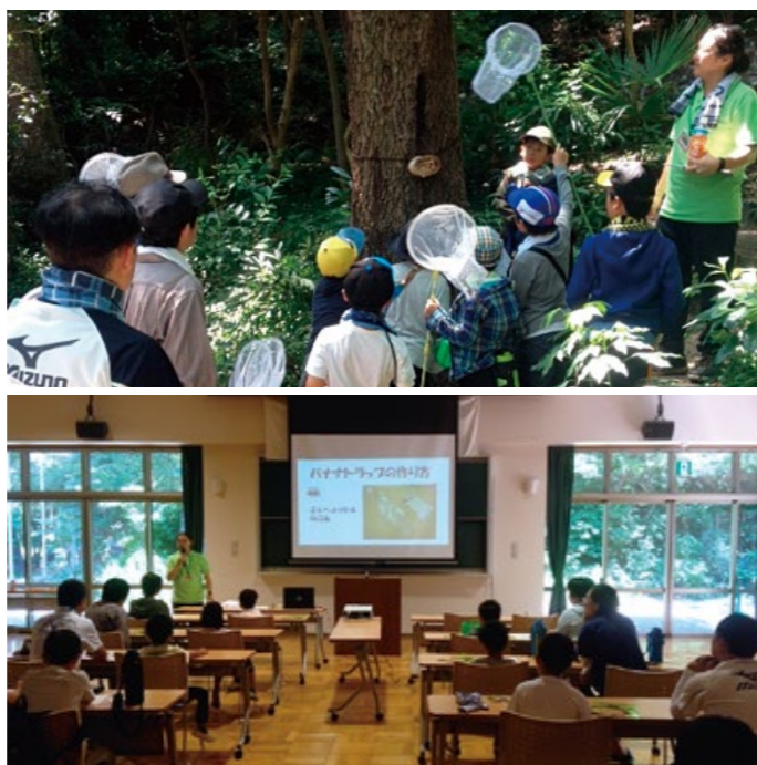
▲昆虫採集・学習の様子

えんてつグループでは、えんてつカードキッズクラブ会員様を対象に、7月に浜松市立青少年の家にて「昆虫採集体験」を開催しました。当日は親子10組の方が参加し、自然とのふれあいや新しいことに興味をもつ大切さを学んでいただきました。