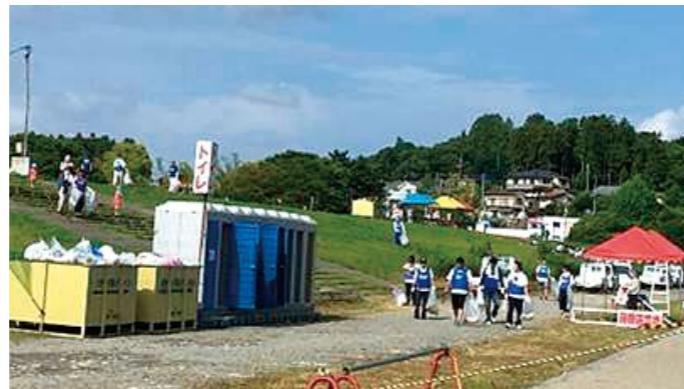
▲ボランティア参加者

当日は早朝にもかかわらず、グループ各社から20名の皆様に参加いただき、たくさんの汗をかきながら会場のごみ拾いを行いました。