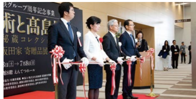
▲テープカットの様子