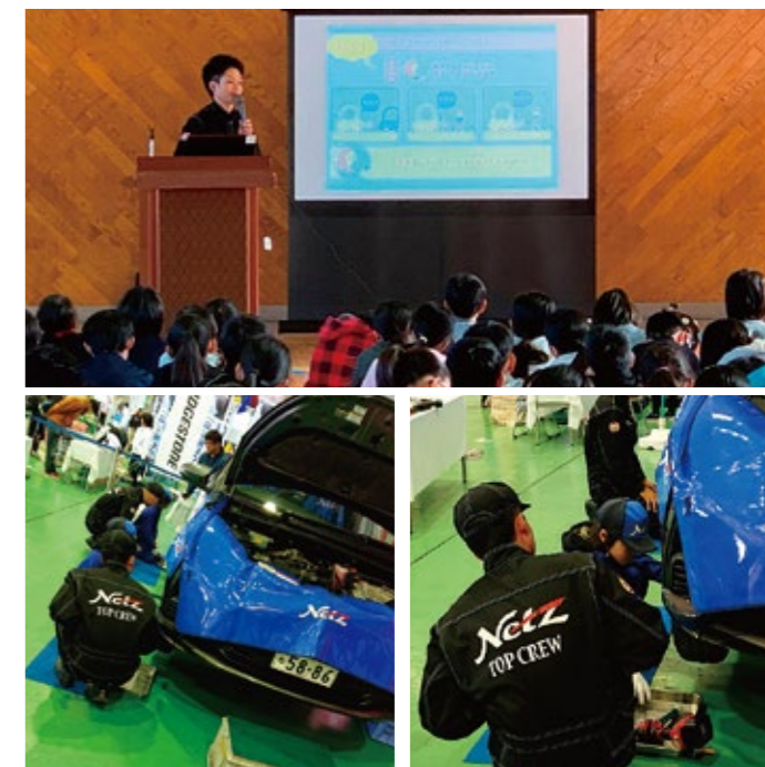
▲出張授業・キッズエンジニア体験の様子

ネットヨタ浜松では、県西部から中部の小・中学校を対象に出張授業や職場体験の受け入れを実施しています。また、自社イベント「わくわくファミリーカーニバル」会場内にて、子供たちがツナギを着て車の整備を体験できる「キッズエンジニア体験」を行っています。身近な自動車により興味・関心を持ってもらえるよう、今後も子供たちに対する活動を継続していきます。