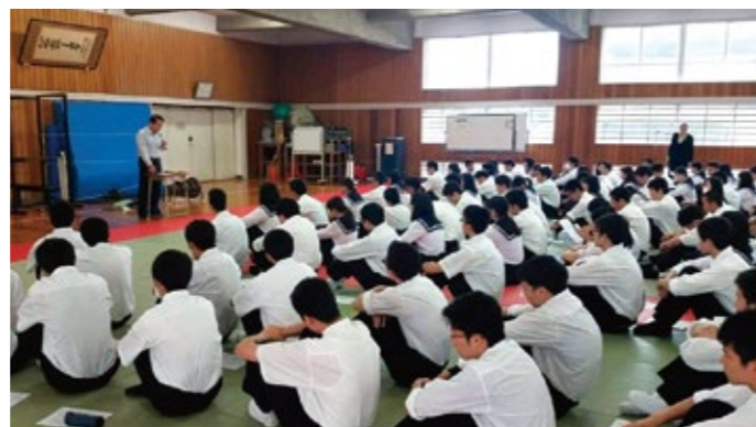
▲高校生向け食中毒予防衛生講習会

遠鉄アシストの食品検査センターでは、浜松市内の高校生向けに、安全に学園祭を運営していただくために、毎年各高校で食中毒の予防に関する衛生講習会を実施しております。食品衛生の基本的な知識を勉強し、食中毒の危険性を理解していただきました。