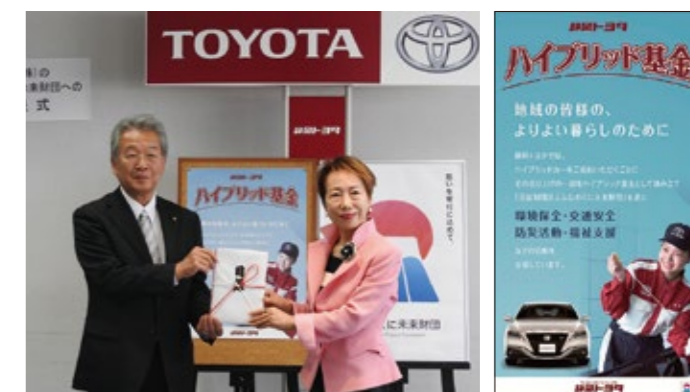
▲ハイブリッド基金贈呈式

静岡トヨタ自動車では、環境にやさしい「プリウス」を発売当初より取扱っておりお客様へ感謝の気持ちを形にした「ハイブリッド基金」を設立。2012年よりハイブリッド車売上の一部を積立て、ふじのくに未来財団を通じ地域に役立つ活動を行うNPO法人へ助成金として毎年寄付を行っています。2018年度の寄付金額は2,750,500円。4月には7回目となる贈呈式を行いました。