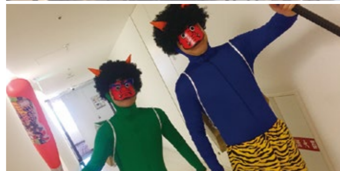
▲ファミリーイベントの様子