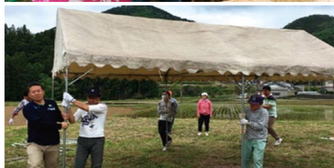
▲一社一村つつじまつり