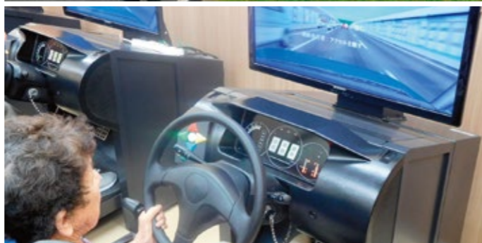
▲交通安全教室の様子