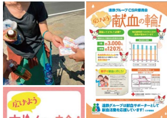
▲献血応援の取り組み

今後も血液の安定供給を支援できるよう、若い世代の献血参加により力を入れて、社員一人一人の当事者意識を育成できるように活動してまいります。