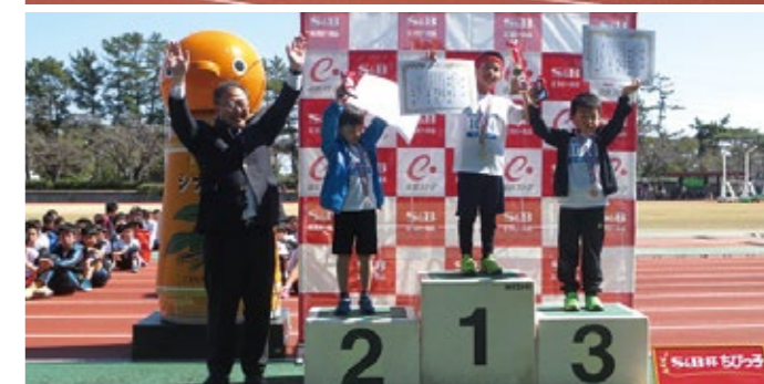
▲浜松四ツ池陸上競技場