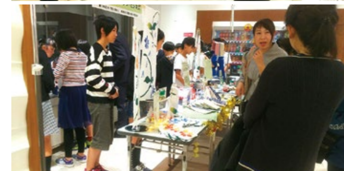
▲接客指導・販売体験の様子