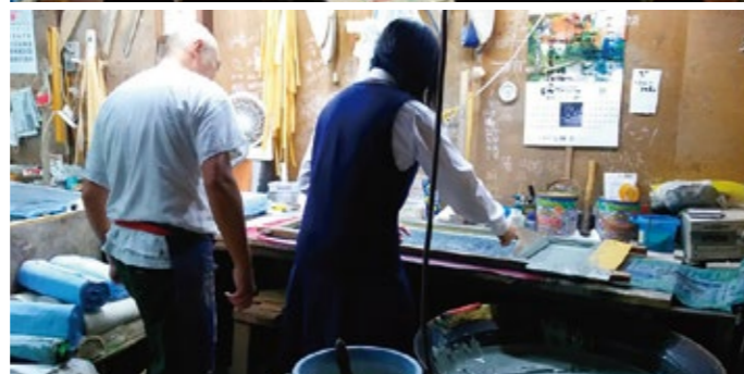
▲手ぬぐい製作の様子