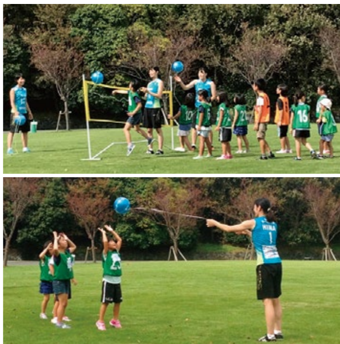
▲バレーボール教室の様子

えんてつグループでは、えんてつカードキッズクラブ会員様を対象に、9月に浜名湖ガーデンパークにて幼稚園～小学生対象のバレーボール教室を開催しました。当日はVリーグチームのプレス浜松のメンバーに講師として来てもらい、子どもたちには思いきり体を動かす楽しさを感じてもらいました。