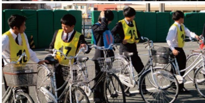
▲交通安全セミナーの様子