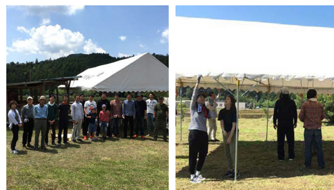
▲渋川つつじまつりの様子