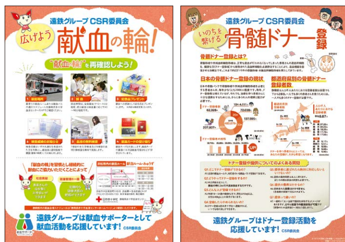
▲献血応援の取り組み

今後も血液の安定供給と骨髄ドナーの登録者数拡大に貢献すべく、社員一人一人の当事者意識を育成できるように活動してまいります。