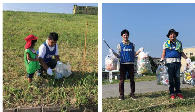
▲ボランティア参加者

当日は早朝にもかかわらず、グループ各社から24名の皆様に参加いただき、たくさんの汗をかきながら会場のごみ拾いを行いました。