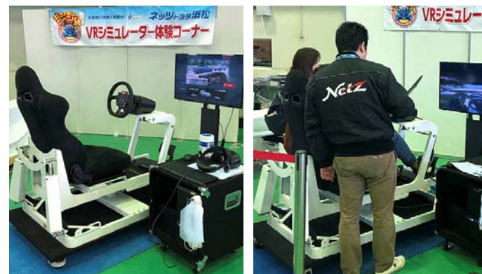
▲VRシミュレーター体験コーナー

車両安全装置の普及、そして交通事故ゼロの社会実現に向け、今後も継続してまいります。