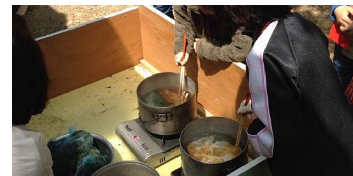
▲草木染め体験の様子