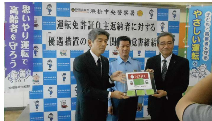
▲浜松中央署との覚書締結式の様子

高齢者による交通事故が増加する中、免許返納後の移動手段に公共交通としてのバス・電車を利用するきっかけをつくることで、運転免許証の自主返納を後押しし、交通事故の抑止につとめました。