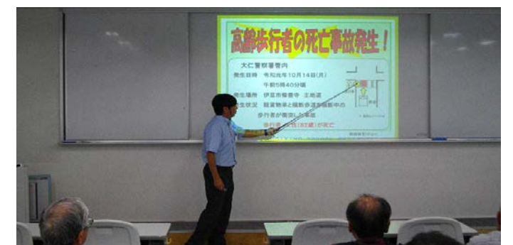
▲交通安全教室の様子