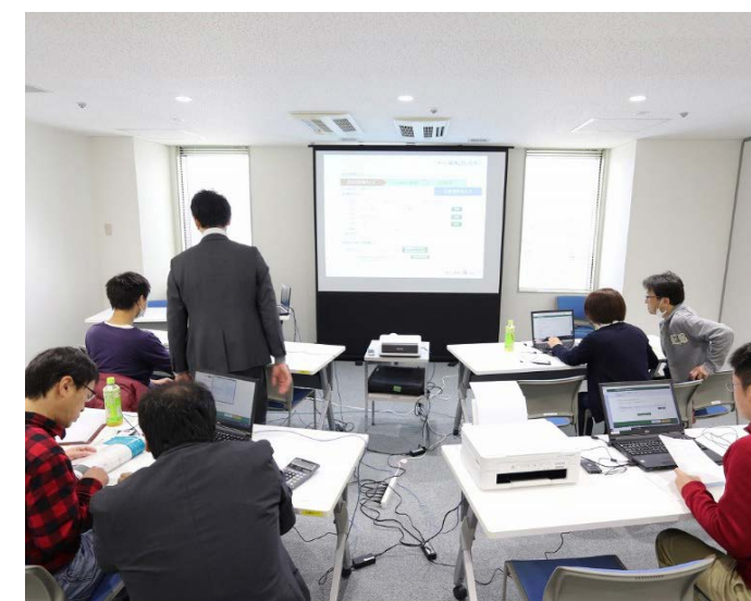
▲確定申告会の様子

確定申告や税務相談は専門性が高いため、参加いただいた皆様から大変ご好評をいただきました。