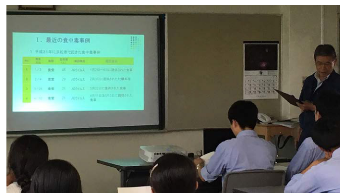
▲衛生講習会の様子

本年は、浜松市内4校の高校に伺いました。食品衛生の基本的な知識を勉強し、食中毒の危険性を理解していただきました。