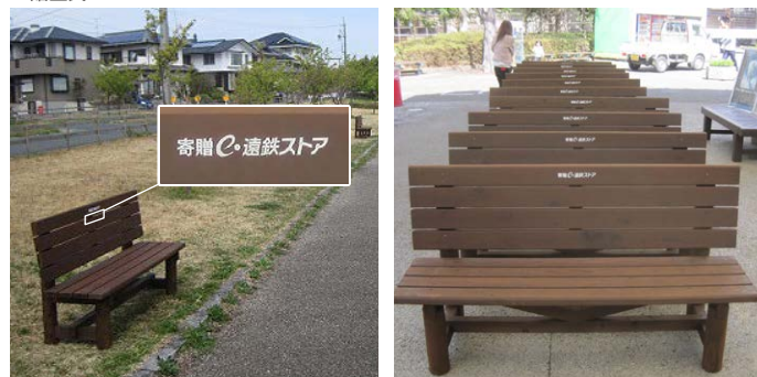
▲ロゴ入り木製ベンチ