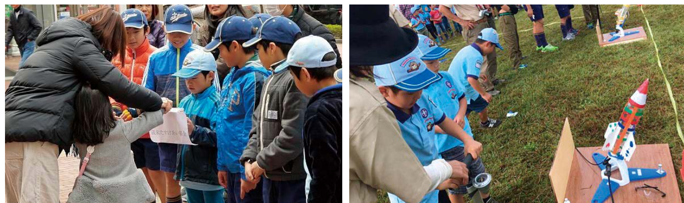
▲ボーイスカウト浜松第11団(遠鉄ボーイスカウト)