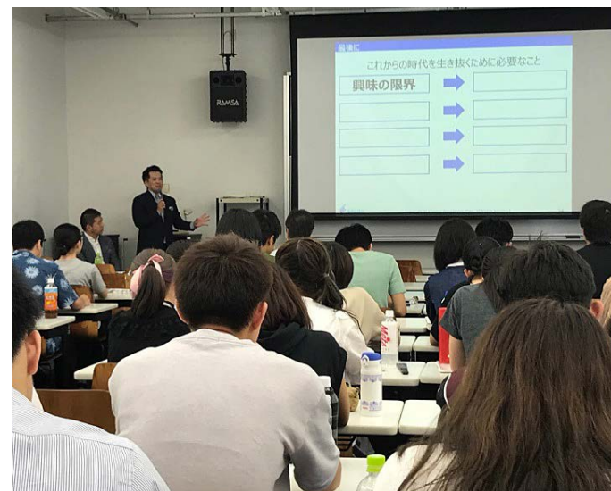
▲マーケティング講座の様子

遠鉄百貨店では、静岡文化芸術大学の学生を対象に、「遠鉄百貨店のマーケティング戦略」の講座を行いました。“小売業の中でマーケティングに携わる現場スタッフの生の声を学生に聞かせてほしい”との依頼を文芸大の教授からいただき、遠鉄百貨店のマーケティング担当者が約100名の学生に向けて講義を行いました。