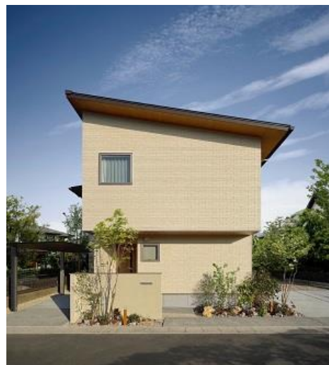
左：SI 事業の役割分担 右：SI 事業 モデル棟

SI 事業は、積水ハウスが耐震面において最も重要な部分である「S（＝スケルトン）」部分の基礎、躯体、接合部を担い、積水ハウスグループの積水ハウス建設が高精度な施工を行います。そして「I（＝インフィル）」部分の外装や内装、設備はパートナー企業が担い、地域での高い土地仕入れ力・販売力を活かし、地域特性に沿った提案を行うなど地域密着型の顧客対応を可能とします。積水ハウスが提供するの、基礎・躯体といったハード面に加え、ソフト面では『SI-COLLABORATION』という「商標の提供」や全邸で実施する「許容応力度による構造計算」など積水ハウスの総合力を活かした各種サポートがあります。